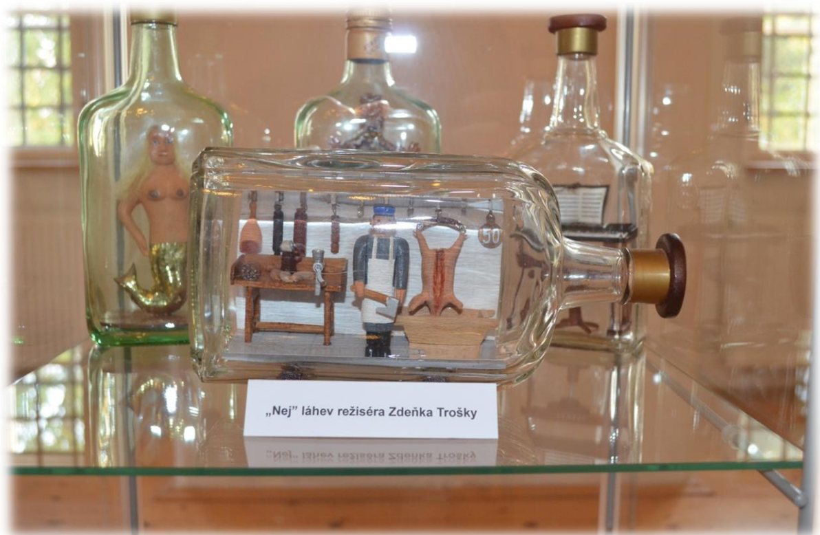
„Nej“ láhev režiséra Zdeňka Trošky